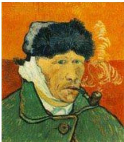
Tentoonstelling over Van Gogh in museum Het Dolhuys In museum

In het Dolhuys in Haarlem is van 24 augustus 2010 tot en met 27 februari 2011 de tentoonstelling ‘Dossier Van Gogh: gek of geniaal?’ te zien.